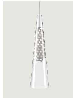
Cono di Luce large