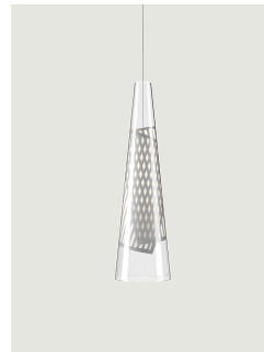
Cono di Luce small