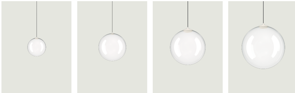
Random Solo 12