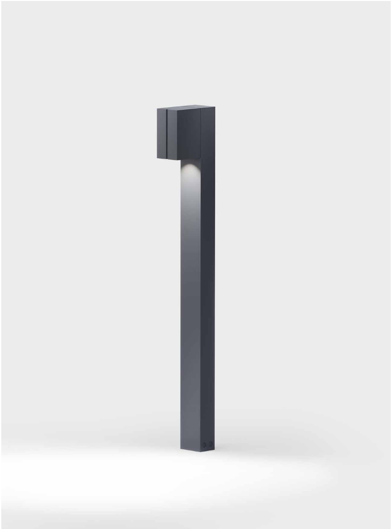
cut poller Design: IP44.de